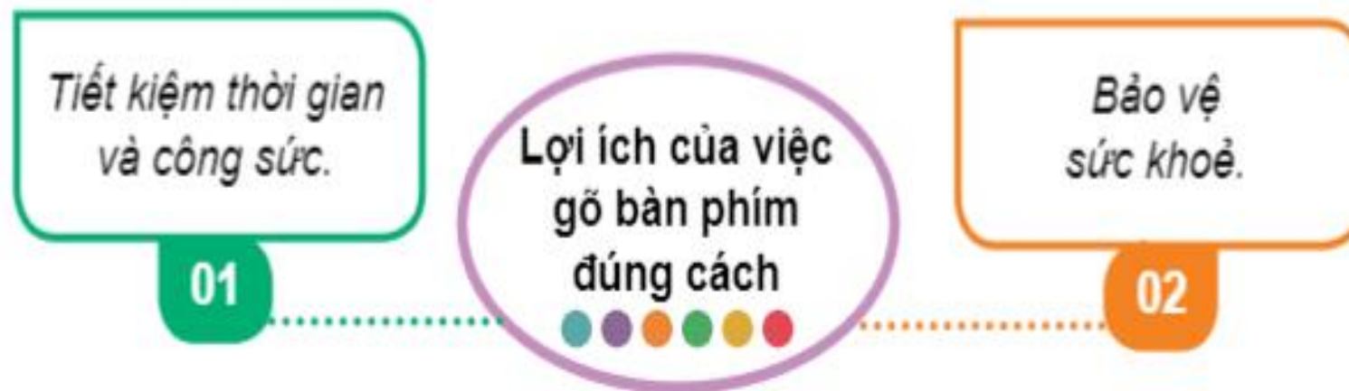
Hình 5: Lợi ích của việc gõ bàn phím đúng cách

Gõ bàn phím đúng cách sẽ giúp em gõ nhanh và chính xác hơn, nhờ vậy em tiết kiệm thời gian và công sức. Khi luyện tập thường xuyên và gõ được đúng cách, em cũng không phải nhìn vào bàn phím và màn hình nhiều nên không bị mỏi mắt, mỏi cổ. Điều này giúp em bảo vệ sức khỏe của mình.