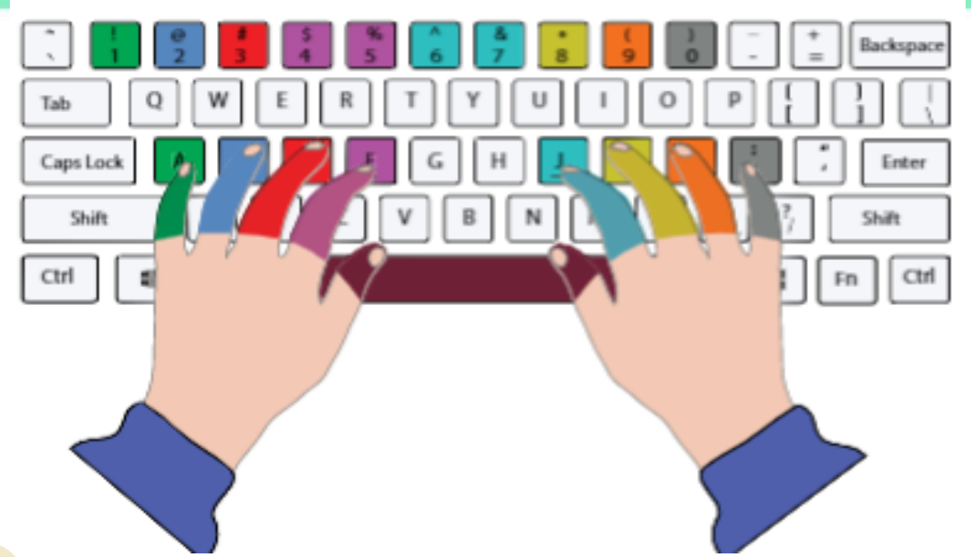
Hình 6: Các ngón tay phụ trách tương ứng cùng màu với các phím số

Khi gõ phím số, các ngón tay của em từ vị trí xuất phát trên hàng phím cơ sở vươn đến gõ phím số. Sau khi gõ xong, đưa các ngón tay trở về vị trí xuất phát. Hình 6 minh họa các ngón tay tương ứng phụ trách gõ các phím số.